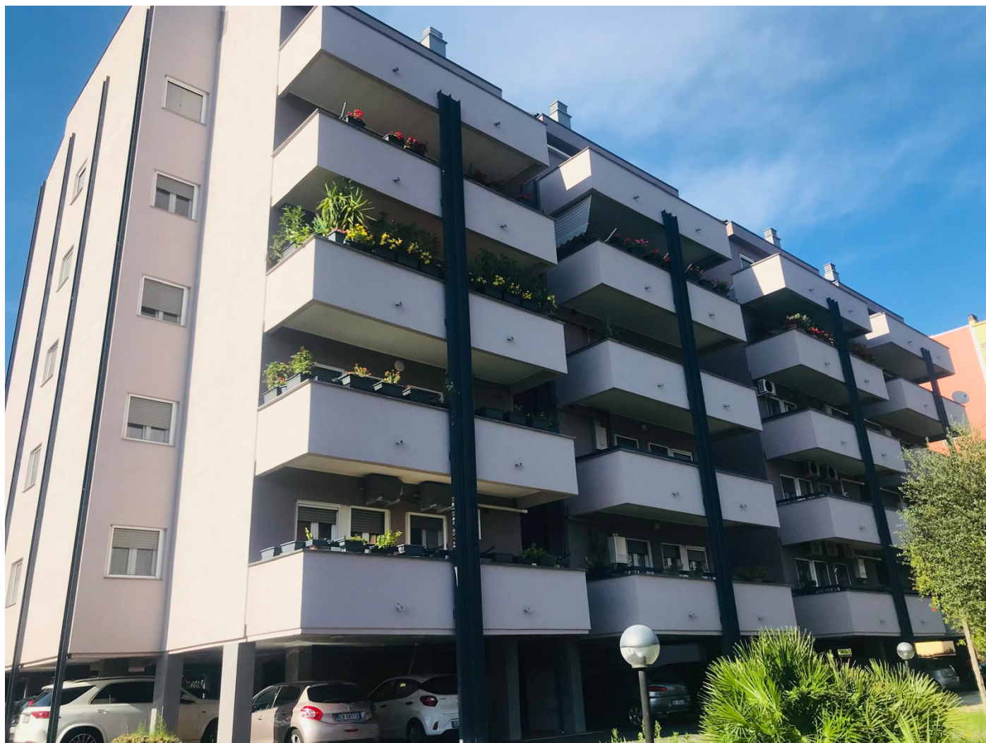
CONDOMINIO IRIS & OMEGA - FROSINONE (LAVORI DI EFFICIENTAMENTO ENERGETICO E MIGLIORAMENTO SISMICO) LAVORI ESEGUITI DA FABRIZI COSTRUZIONI SRL