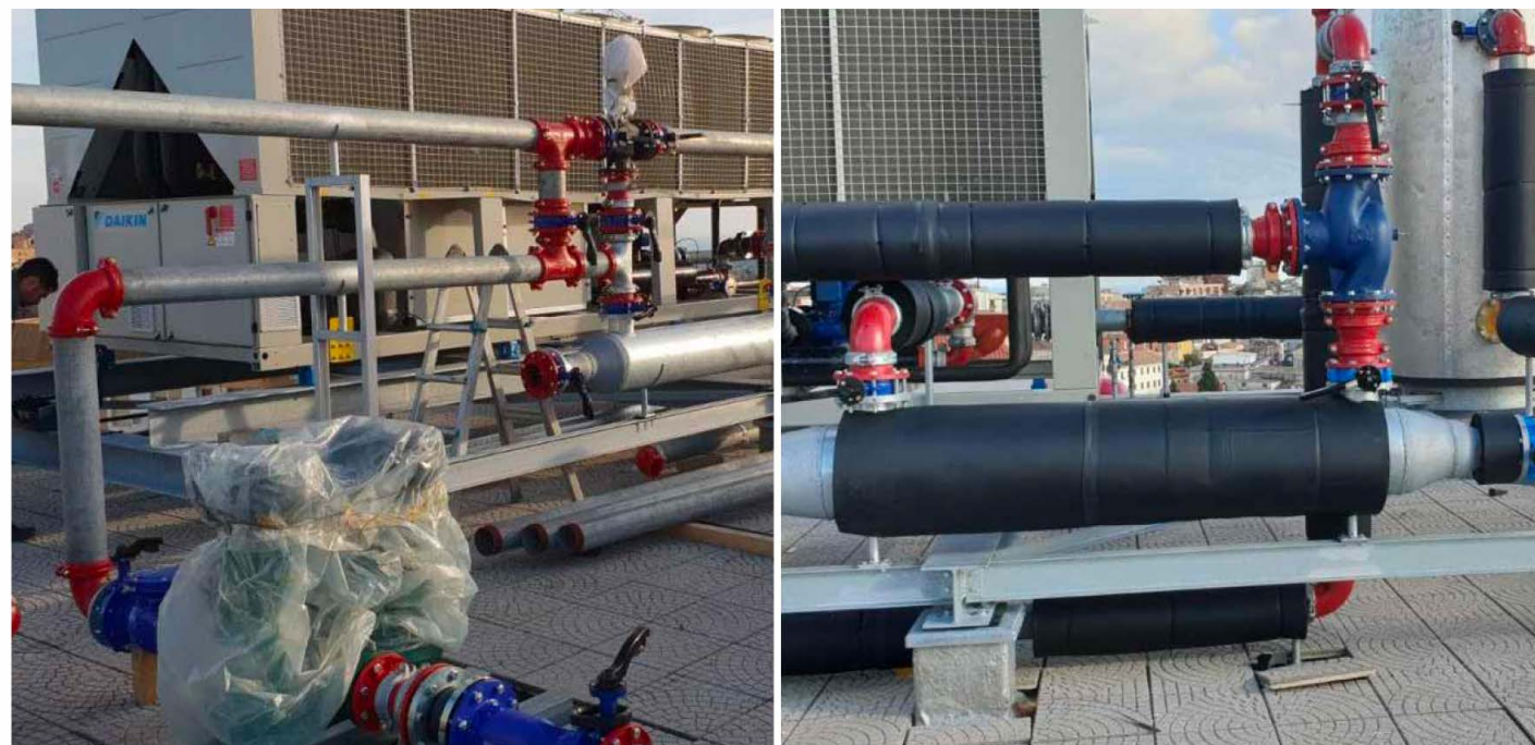
DIREZIONE PROVINCIALE INPS DI CATANZARO (LAVORI DI REALIZZAZIONE IMPIANTO DI CLIMATIZZAZIONE) LAVORI ESEGUITI DA BDM GROUP SRL