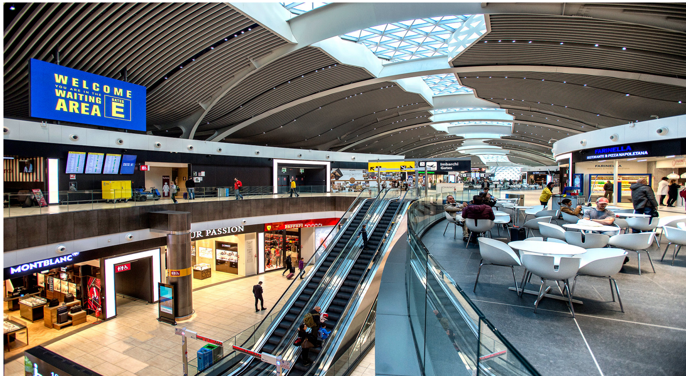
AEREOPORTO DI FIUMICINO - ROMA LAVORI ESEGUITI DA EDIL NOVA SRL