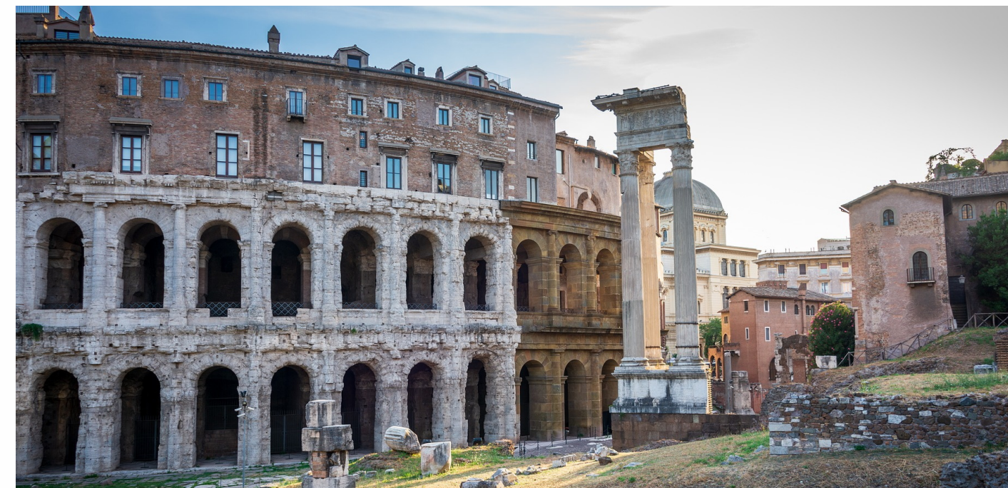
TEATRO MARCELLO - ROMA (LAVORI DI MANUTENZIONE E SISTEMAZIONE ESTERNA) LAVORI ESEGUITI DA PIACENTINI APPALTI SRL