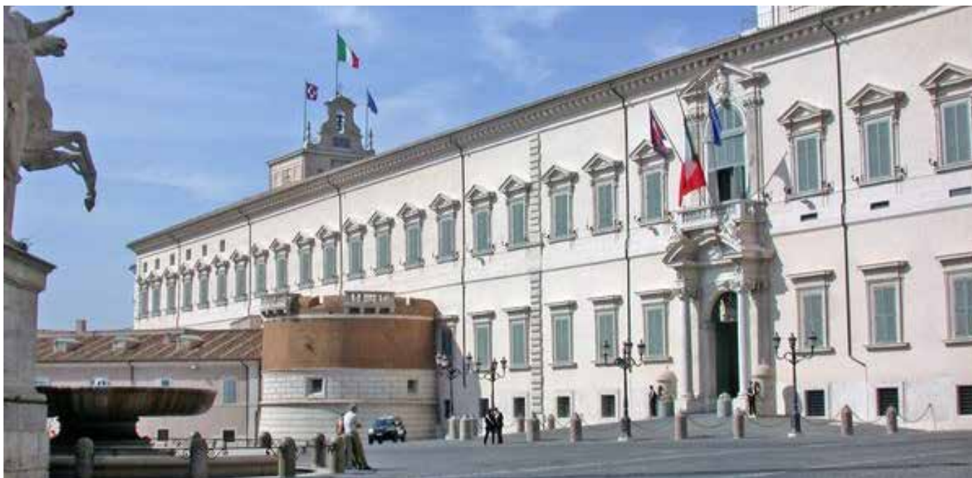
PALAZZO DEL QUIRINALE - ROMA LAVORI ESEGUITI DA EDIL NOVA SRL