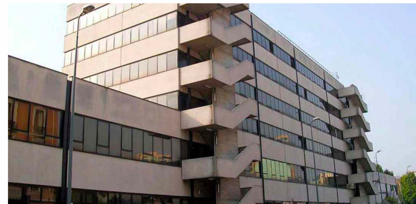
IDEA FIMIT SGR FONDO ATLANTIC 2 BERENICE - ROMA (LAVORI DI EFFICIENTAMENTO ENERGETICO E IMPIANTO ANTINCENDIO) LAVORI ESEGUITI DA C.R.E. SRL