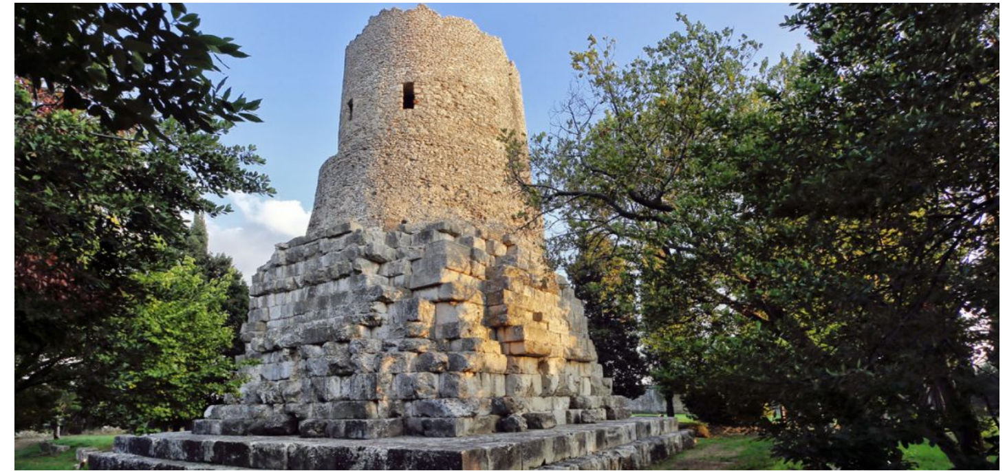
TOMBA DI CICERONE - FORMIA LAVORI ESEGUITI DA SINERGY SRL