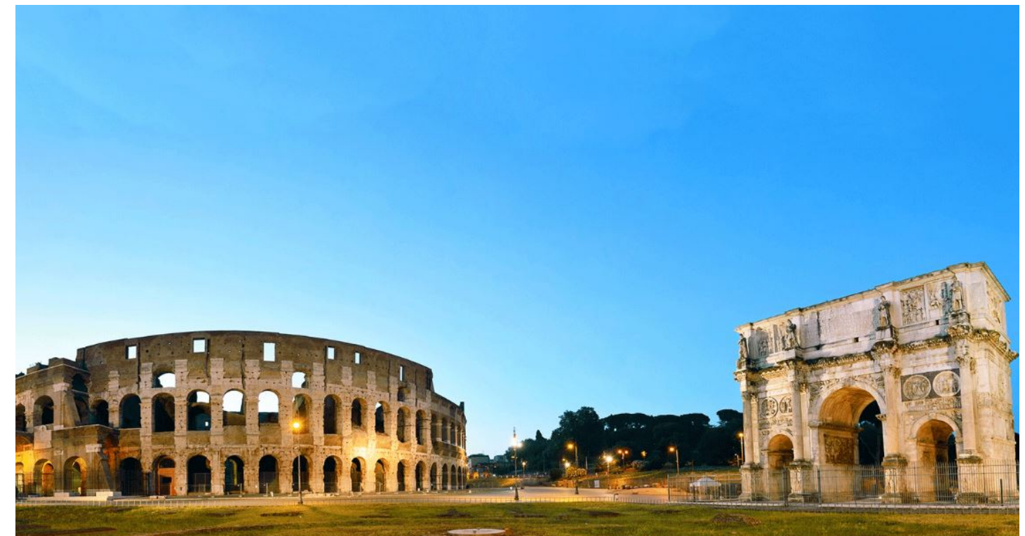
COLOSSEO ED ARCO DI TITO - ROMA LAVORI ESEGUITI DA EDILIZIA FALPO SRL