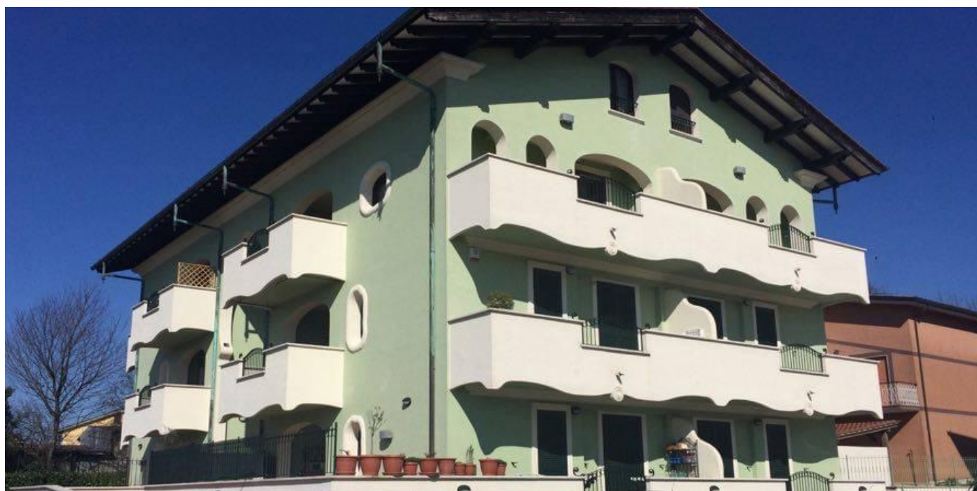
PALAZZINA RESIDENZIALE IN VALMONTONE - ROMA LAVORI ESEGUITI DA PIACENTINI APPALTI SRL