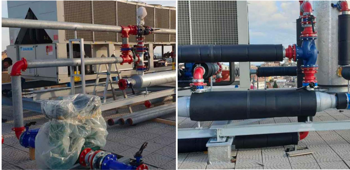
DIREZIONE PROVINCIALE INPS DI CATANZARO (LAVORI DI REALIZZAZIONE IMPIANTO DI CLIMATIZZAZIONE) LAVORI ESEGUITI DA BDM GROUP SRL