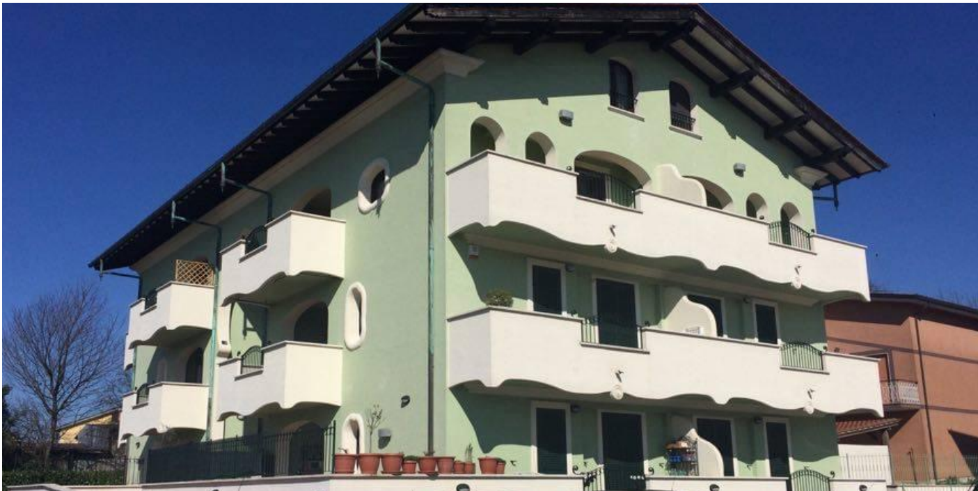
PALAZZINA RESIDENZIALE IN VALMONTONE - ROMA LAVORI ESEGUITI DA PIACENTINI APPALTI SRL