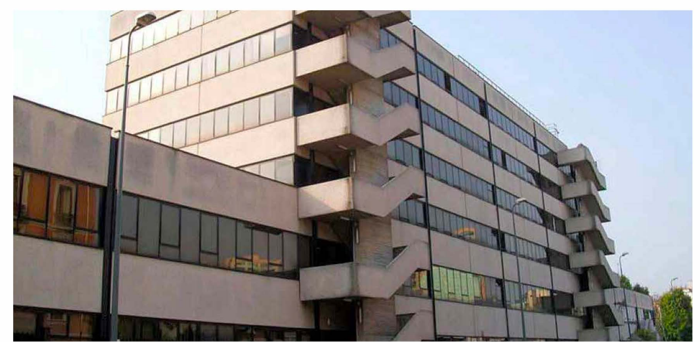
IDEA FIMIT SGR FONDO ATLANTIC 2 BERENICE - ROMA (LAVORI DI EFFICIENTAMENTO ENERGETICO E IMPIANTO ANTINCENDIO) LAVORI ESEGUITI DA C.R.E. SRL