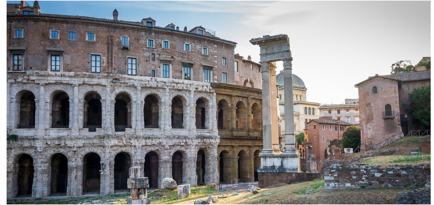
TEATRO MARCELLO - ROMA (LAVORI DI MANUTENZIONE E SISTEMAZIONE ESTERNA) LAVORI ESEGUITI DA PIACENTINI APPALTI SRL